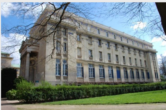
La Fondation, vue de l'extérieur

Elle est administrée par un Conseil d'administration présidé par l'Ambassadeur de Grèce en France et composé du Recteur des Universités de Paris, du Président de la Fondation Nationale pour la Cité Internationale Universitaire de Paris, de trois personnalités françaises et de trois personnalités grecques.