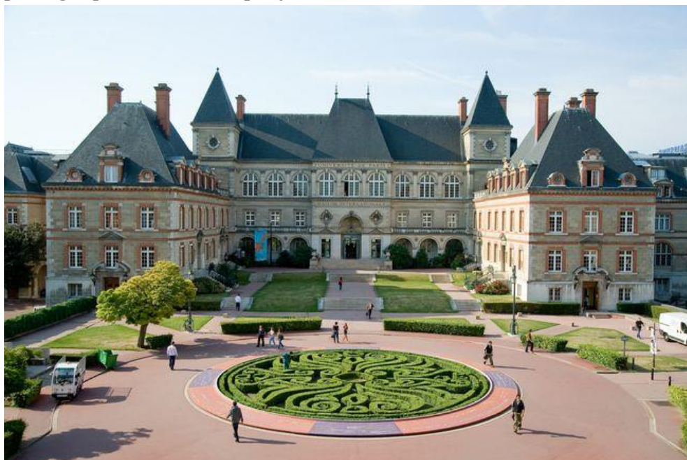
La Maison Internationale, achevée en 1935, qui abrite un restaurant, une bibliothèque, une piscine, des salons

Elle est aujourd'hui un lieu unique d'échanges entre étudiants , chercheurs et artistes de haut niveau venus du monde entier, qui continue de porter haut ses valeurs fondatrices de tolérance et de partage, plus actuelles que jamais.