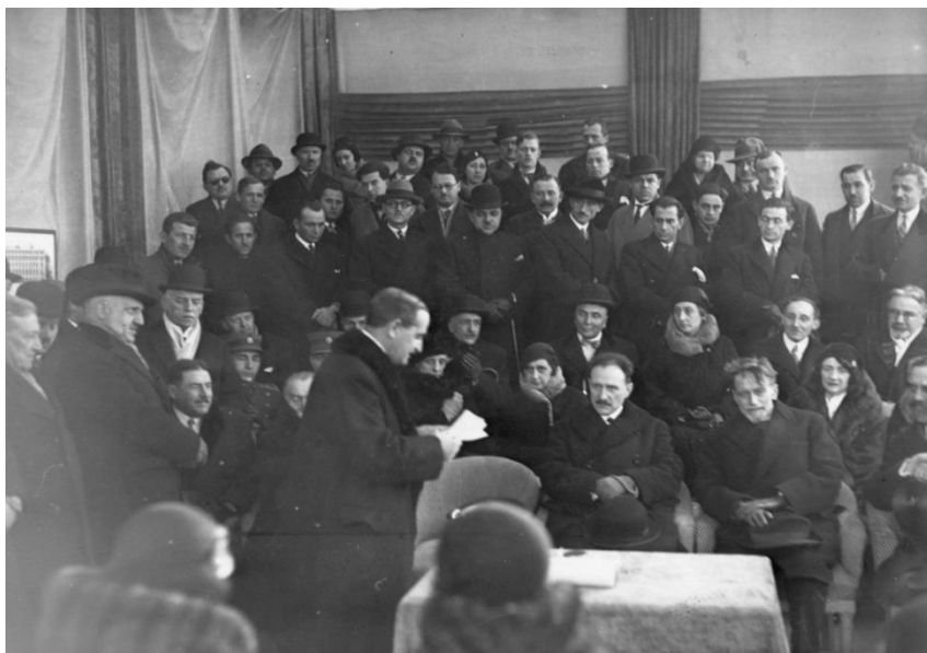
Allocution de M. Politis, Ambassadeur de Grèce, à la cérémonie de la pose de la première pierre, 14 janvier 1931