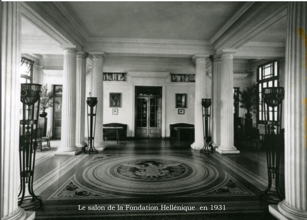
Le salon de la Fondation Hellénique en 1931