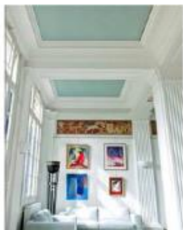
Le salon de la Fondation Hellénique