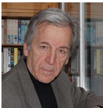
Costa Gavras, Ancien résident de la Fondation

Le metteur en scène Costa Gavras a résidé à la Fondation Hellénique en 1957.