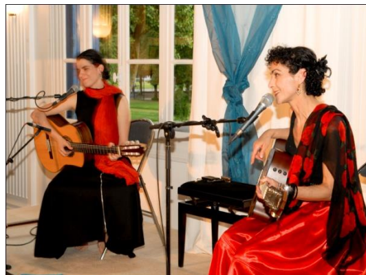
La chanteuse Angélique Ionatos accompagnée de la chanteuse et guitariste Catherine Fotinaki.

La Fondation Hellénique a également contribué à de grandes manifestations comme le festival UNESCO des films francophones. Elle co-organise des événements en partenariat avec d'autres maisons de la cité internationale : plusieurs cycles de tables-rondes ont ainsi eu lieu au cours des dernières années sur un ensemble de questions liées à l'actualité sociale et culturelle européenne.