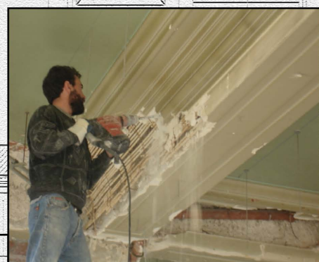
Démontage des fragments de moulures existant sous le faux-plafond - Novembre 2007 -