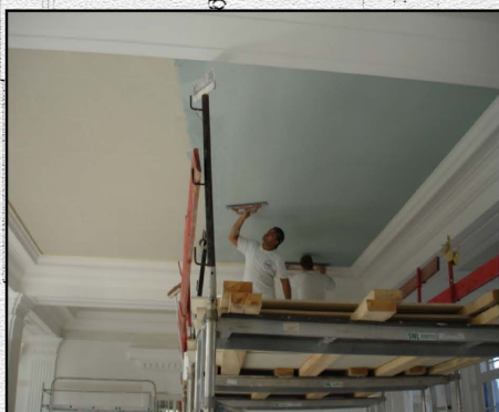
Application du plafond acoustique à base de pâte de marbre - Février 2008 -