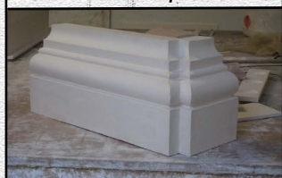
Base des pilastres