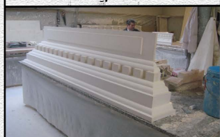
Dessus des portes