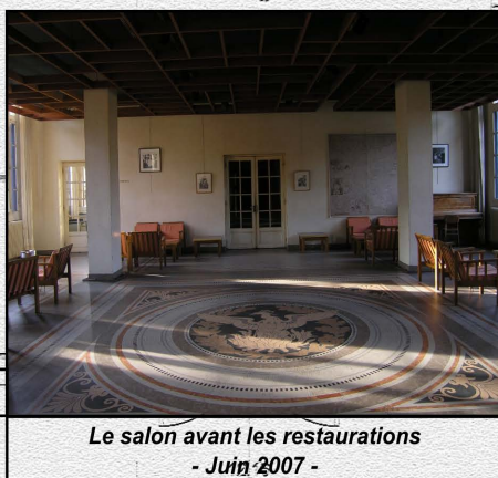
Le salon avant les restaurations - Juin 2007 -