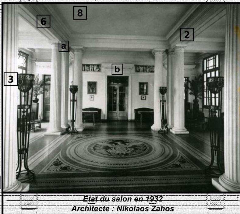
Etat du salon en 1932 Architecte : Nikolaos Zahos