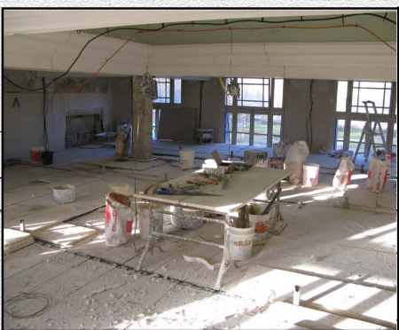
Aménagement d'un plancher de travail au-dessus du sol du salon - Janvier 2008 -