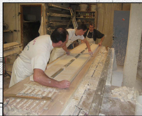
Fabrication des éléments décoratifs du salon à l'aide de moules dans l'atelier

CETTE RESTAURATION A ÉTÉ RENDUE POSSIBLE GRÂCE AU SOUTIEN FINANCIER DE LA FONDATION NIARCHOS