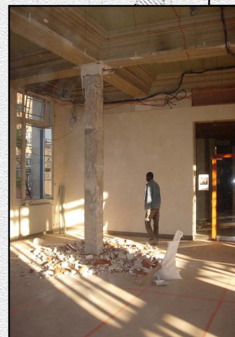
Mise à nu de la structure des colonnes en béton - Décembre 2007 -